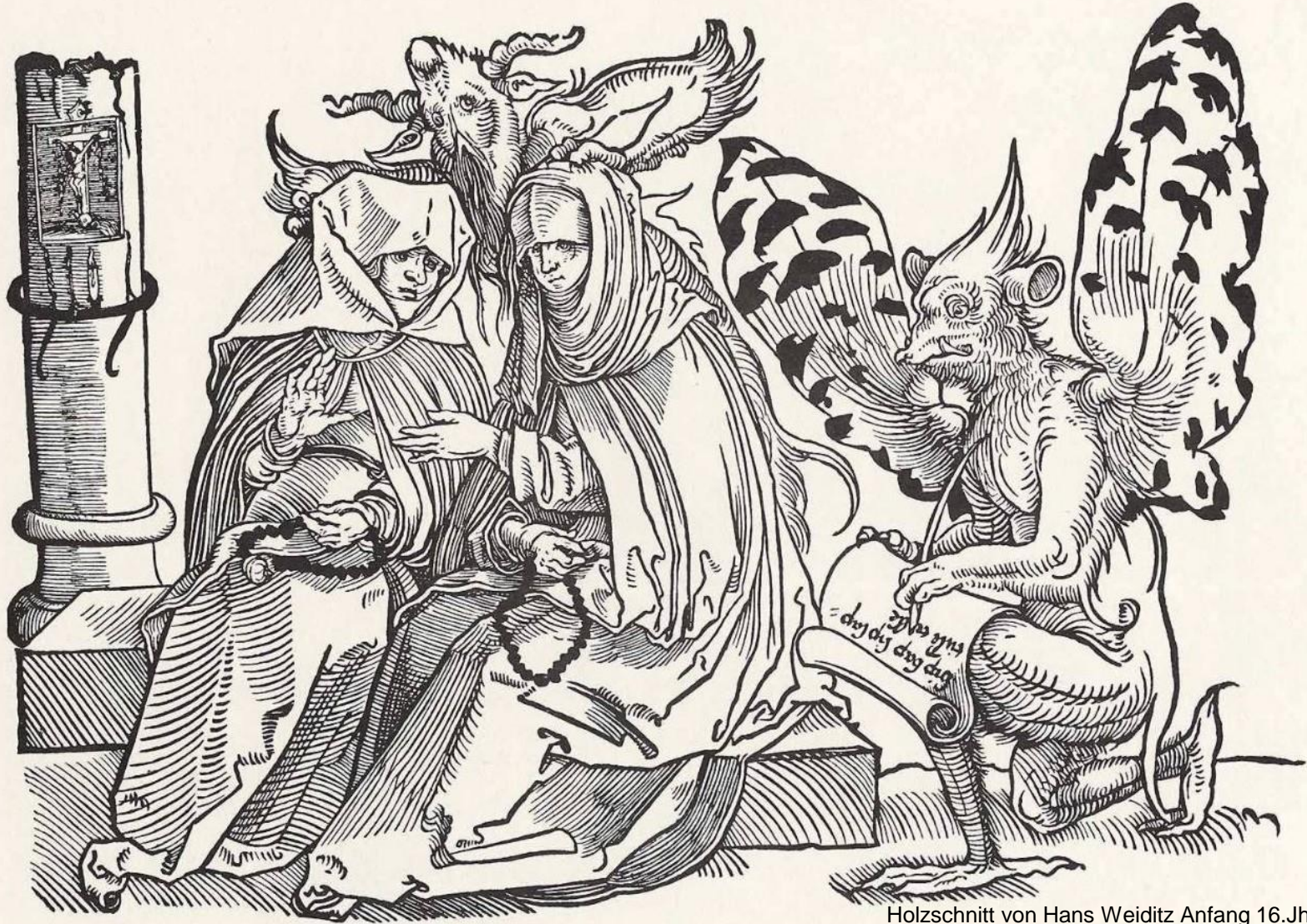
Holzschnitt von Hans Weiditz Anfang 16.Jh.