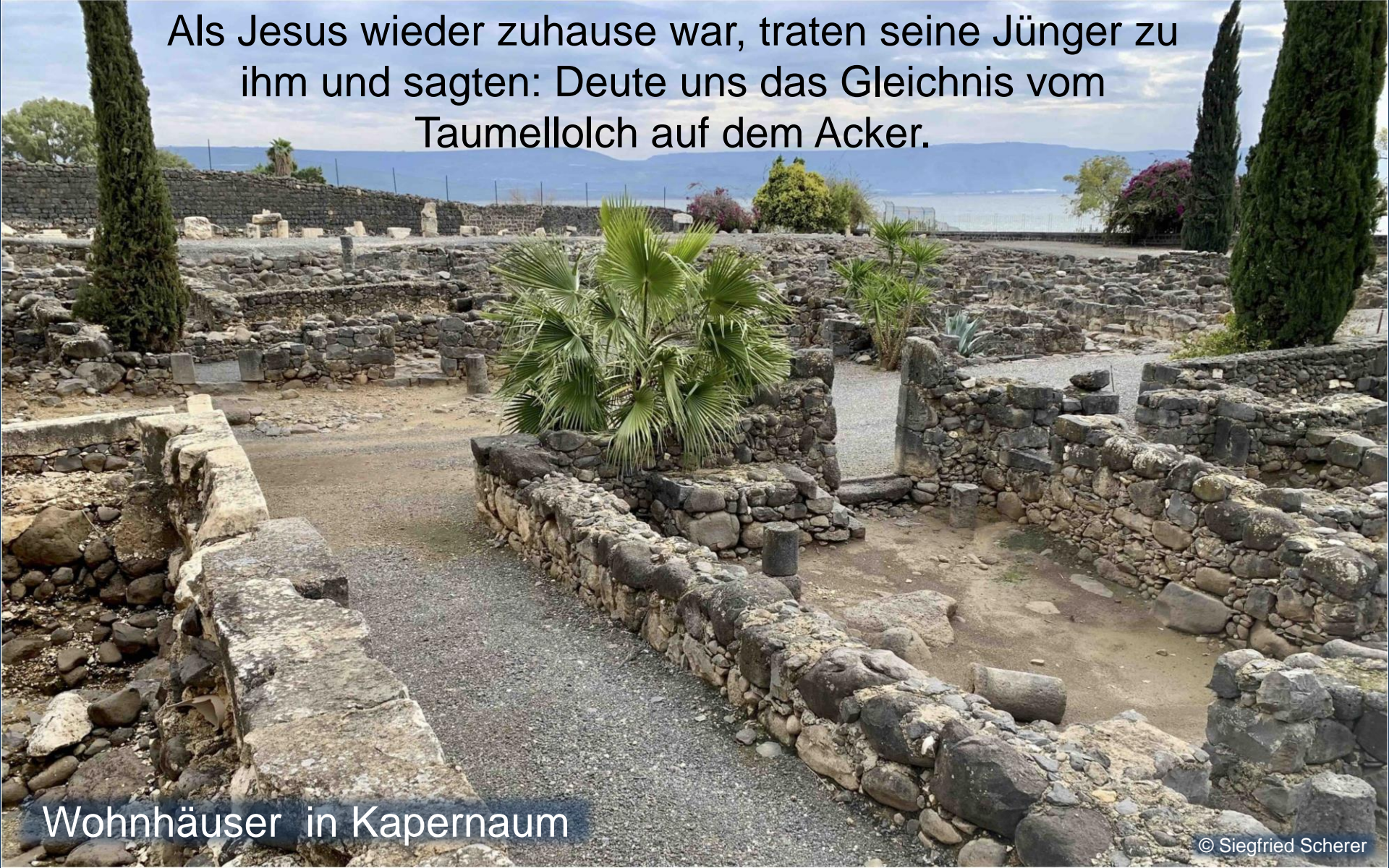
Wohnhäuser in Kapernaum

Als Jesus wieder zuhause war, traten seine Jünger zu ihm und sagten: Deute uns das Gleichnis vom Taumelloch auf dem Acker.