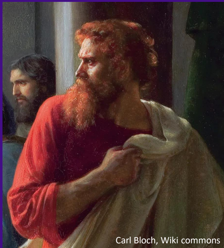
Carl Bloch